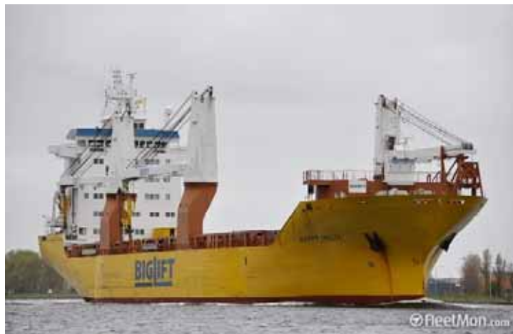
Happy Delta Fleetmon kagitauyainit

Baffinland uktukhimayut angililugit hanayakhat nuutilugit ukiuk tamaat, angiyumut ukiut havagutikhainik. Hamna Ilangani 2mi uktukhimayait.