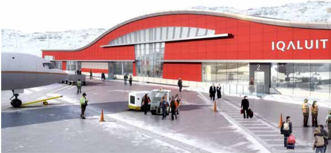
Uktuniaktait Nutaak Iqaluit Tingmiakavikhaa Stanteekut Kagitauyainit

Nutaak Iqalumi tingiakavik pipkailituk piyumayainik akyagutikhait inikhainut iniktigiaganik ukiumi 2017. Kitkaniituk ilanga nutaak tingmiakavikhak, ikayukvikhait ikluit, nutaak milvikhak ovalo nutaak uhiiyavihak. Piyumayait pipkaihimayait NEASKut atuklugit umiamik hivulimi auyami akyaklutik Iqalumut.