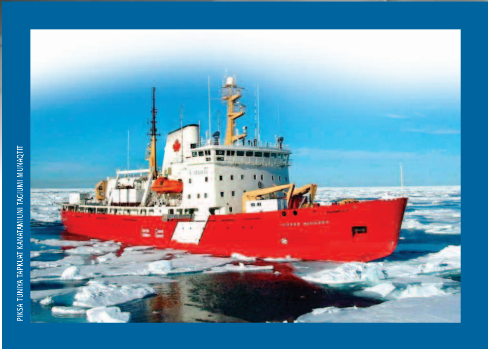
PIKSA TUNIYA TAPKUAT KANATAMI UNI TACIUMI MUNAQIT