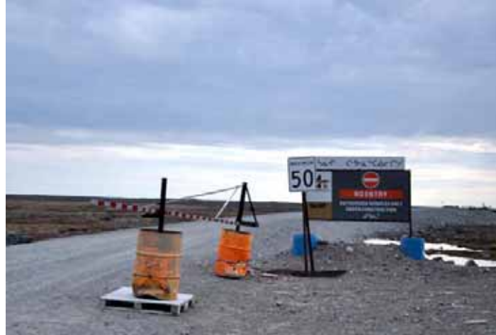
Takuyakhak itiktigainut uyagakhiukvik Agnico Eaglemi 24-kilometre apkotikhaa Kangiklinimit Meliadine uyagakhiukvikhainut