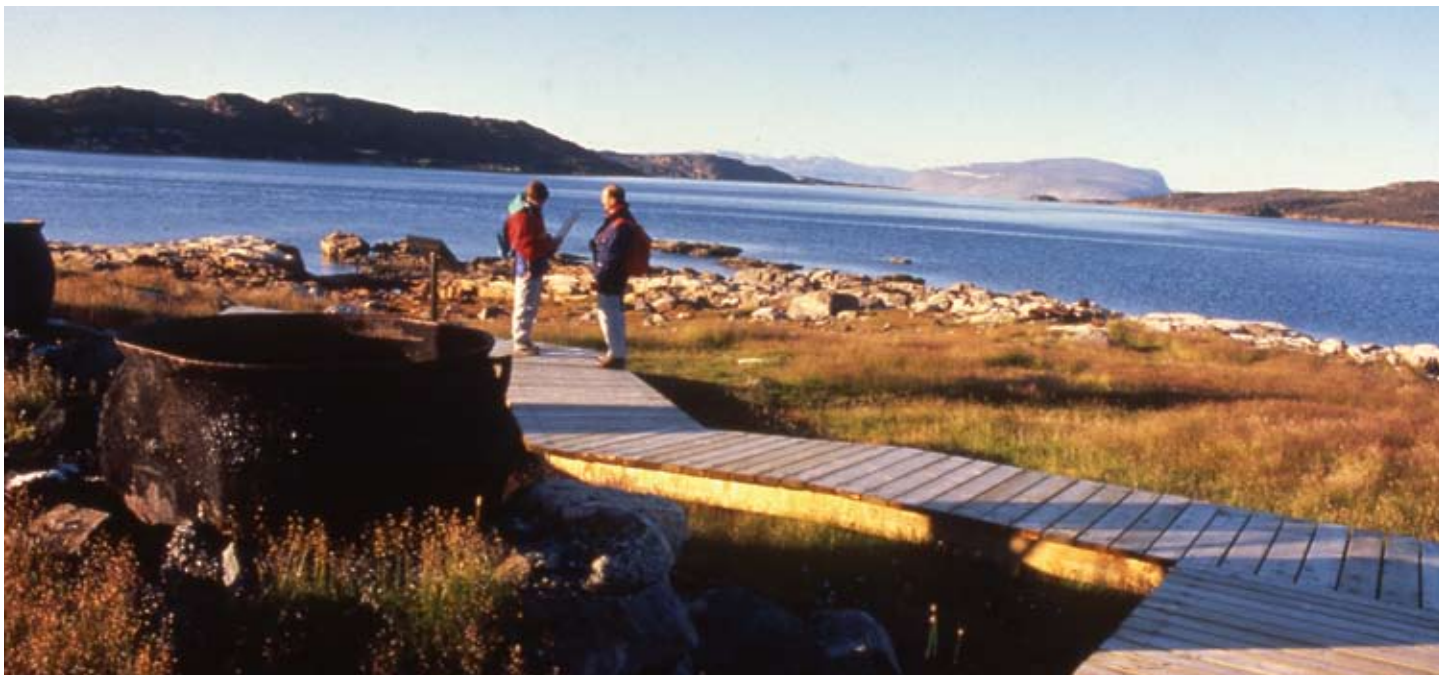
Nunavumi Pulaakatakviiit ovalo Nutaat Nunait – Taiguaktakbat

NUNAVUT PARKS ᑕᑖᑎᑕᑎᑎᑕᑎᑕᑎᑕᑎᑕ PARCS NUNAVUT