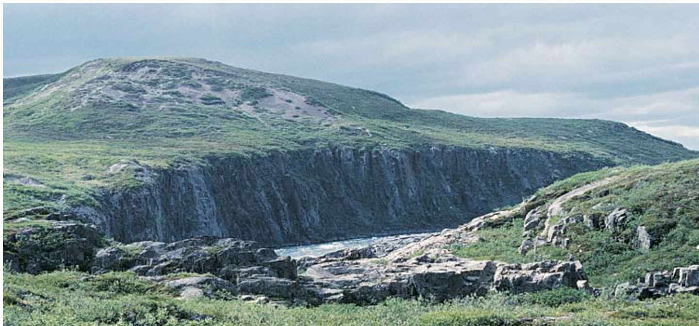
Nunavumi Pulaakatakviit ovalo Nutaat Nunait – Taiguaktakbat

NUNAVUT PARKS ᐅᐅᐅᐅᐅᐅᐅᐅᐅᐅᐅᐅᐅ PARCS NUNAVUT