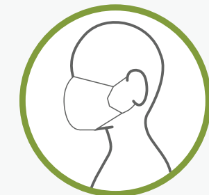
MASQUE NON COUSU FAIT D'UN FOULARD REPLIÉ/BANDANA ET DE BANDES ÉLASTIQUES/ ATTACHE-CHEVEUX