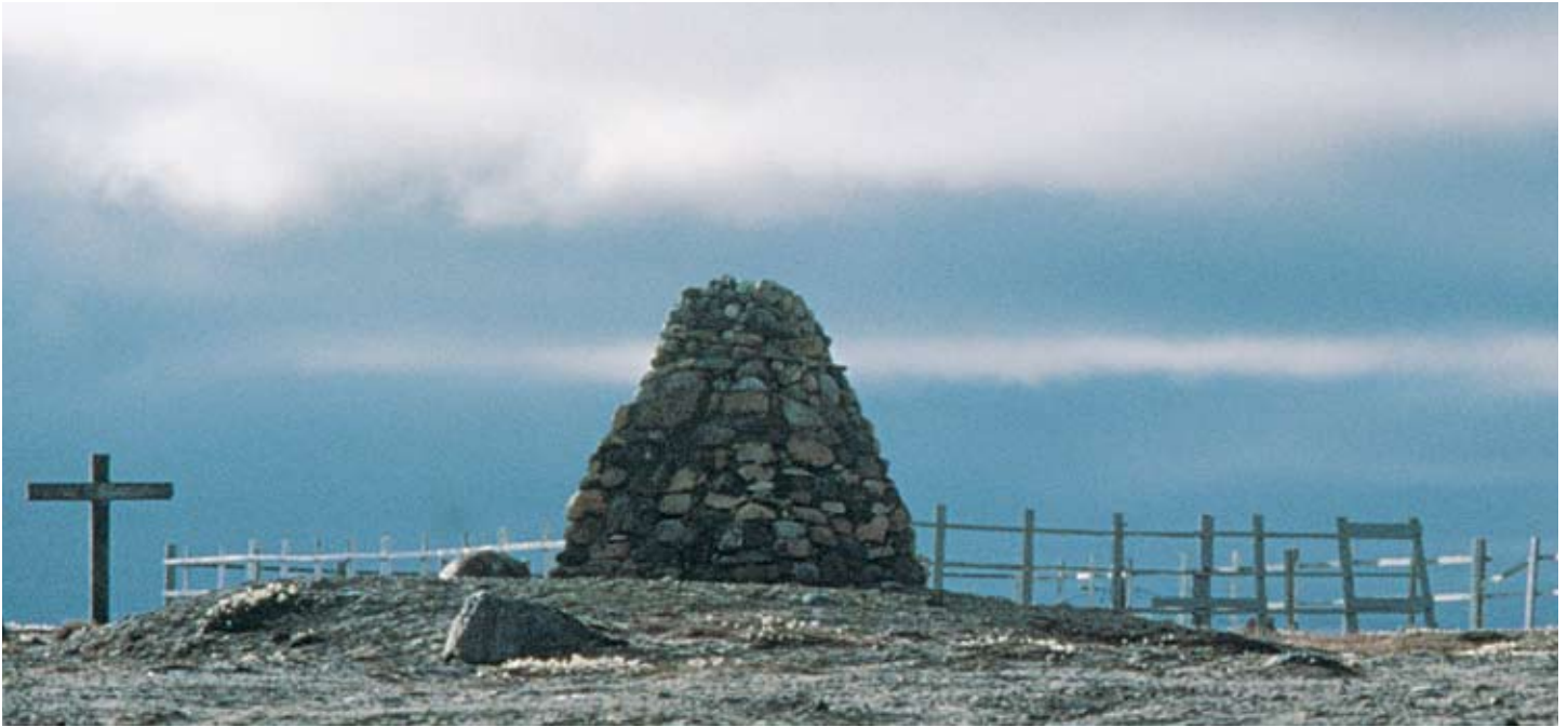
Nunavumi Pulaakatakviit ovalo Nutaat Nunait – Taiguaktakhat